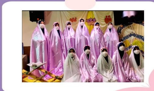
هم خوانی اسماء الحسنی دانش آموزان پایه ی پنجم دبستان دخترانه امام علی (ع)