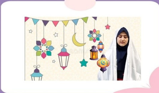
خطبه خوانی دانش آموز پایه ی ششم دبستان دخترانه امام علی (ع)