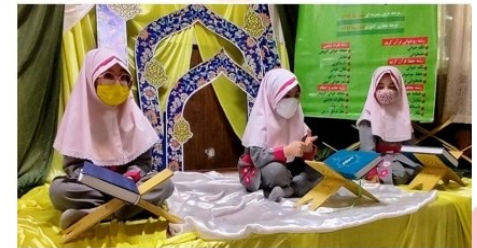
مسابقات قرآن درون مدرسه ای دبستان دخترانه امام علی (ع)